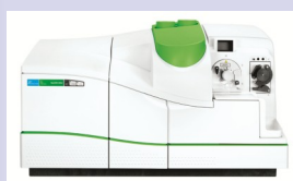
NexION 300 ICP-MS

Traduction CORLEO Translation Franck Bélanger corleotranslation@hotmail.com 514 756-6078